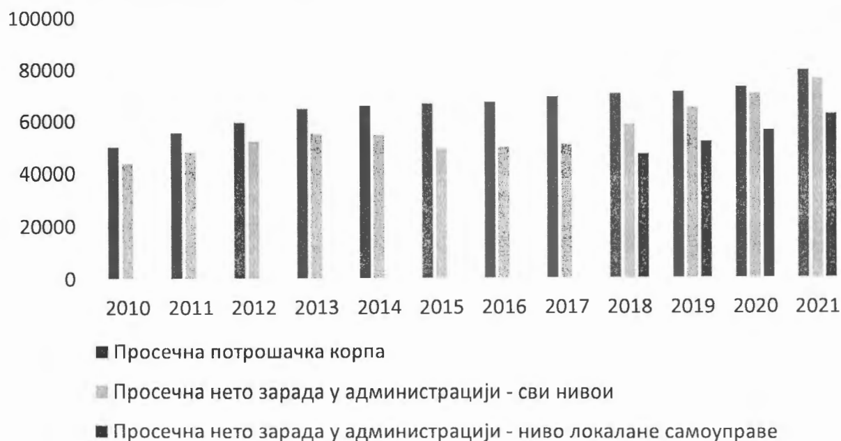
Графикон 1: Однос просечне нето зараде у администрацији и просечне потрошачке корпе у периоду од 2010. до 2021. године

Однос просечне зараде у администрацији – сви нивои и просечне зараде у администрацији – пиво локалне самоуправе и просечне потрошачке корпе, дајемо у следећем графикону.